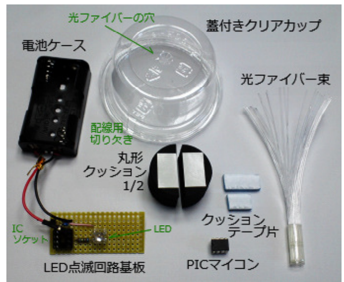
組み立てキット内容